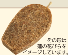
その形は蓮の花びらをイメージしています。

植物由来の廃蠟おが粉着火剤「京蓮火」は、ネストラボ京都の利用者さんが一つ一つ手作りしている商品です。京都のお寺からお裾分けいただいた和蠟燭の廃蠟と北山杉のおが粉を主成分にした自然に優しい着火剤です。