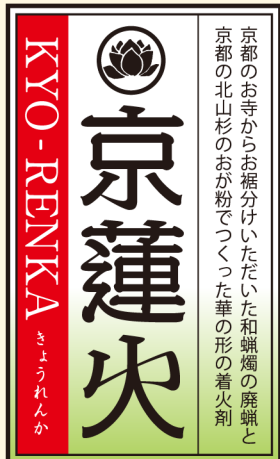
京都のお寺からお裾分けいただいた和蠟燭の廃蠟と京都の北山杉のおが粉でつくった華の形の着火剤