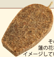
その形は蓮の花びらをイメージしています。