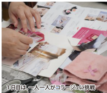
1日目は、一人一人がコラージュに挑戦