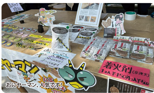
おにやーマン、人気です!