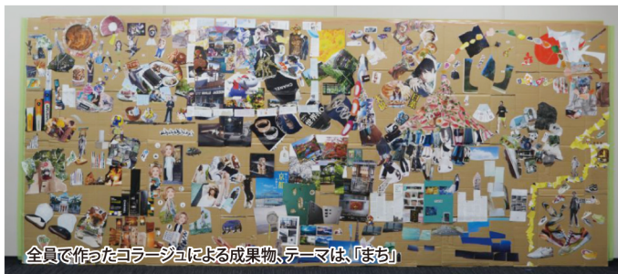
全員で作ったコラージュによる成果物、テーマは、「まち」