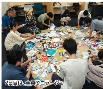
2日目は、全員でコラージュ