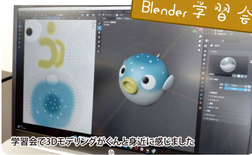
学習会で3Dモデリングが今んと身近に感じました